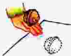
Покажемся с горки

Занимайтесь систематически, но не более 5–10 мин в день.